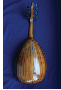
Ş. Muhittin Targan'ın küçük çocuk udu (tekne)